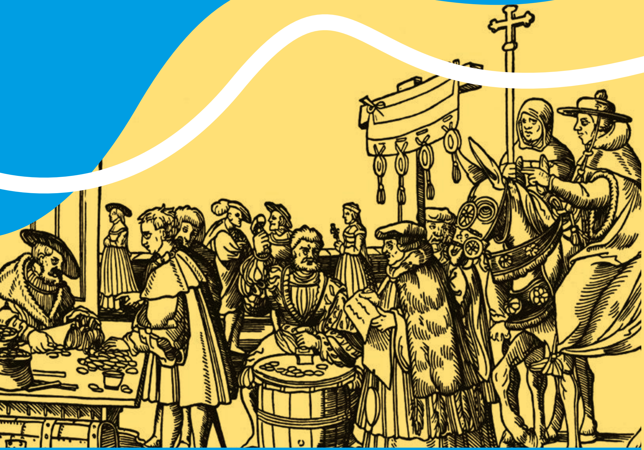
Vente des indulgences Jörg Breu l'Ancien, Bois gravé, c. 1530