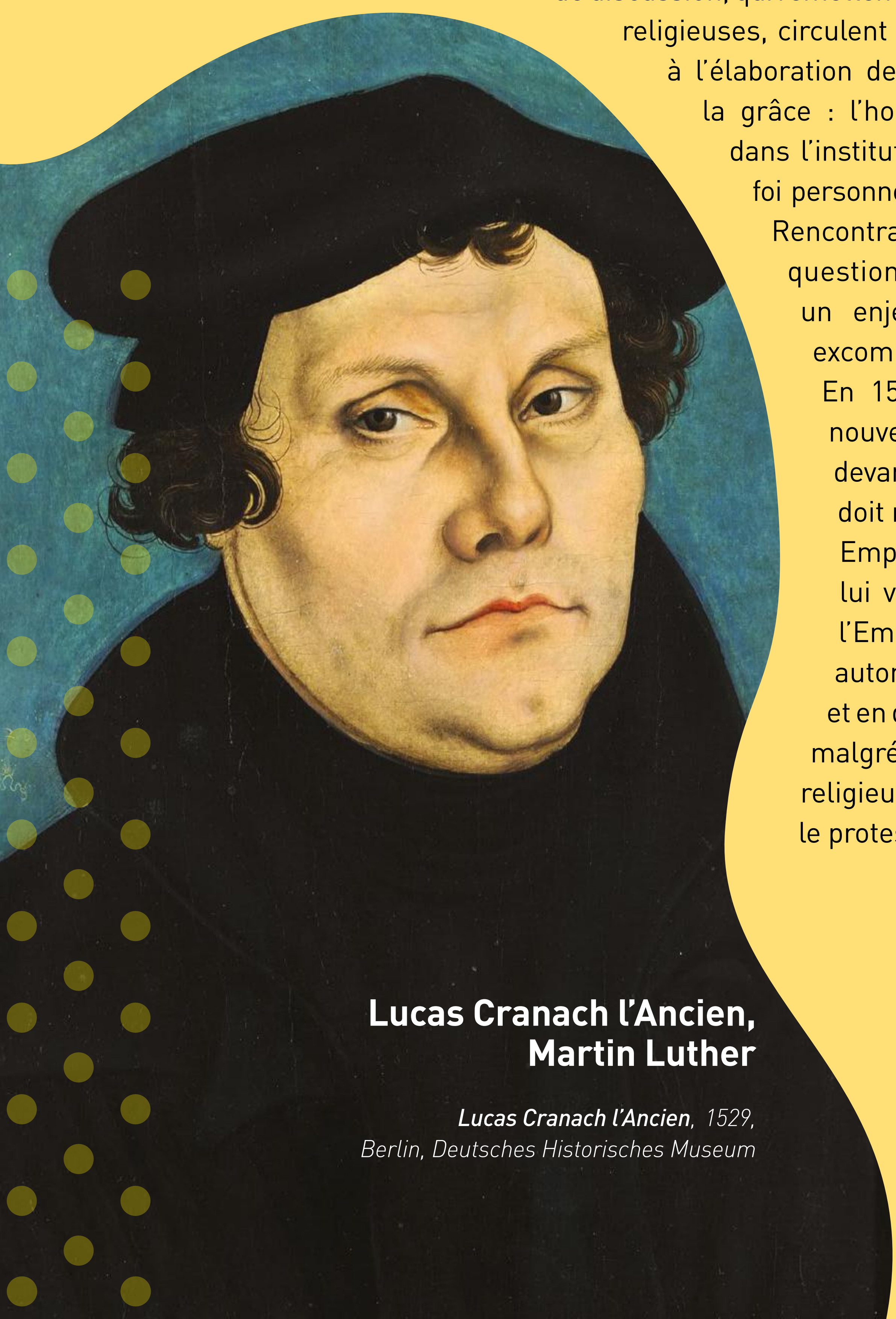
Lucas Cranach l'Ancien, Martin Luther

Rencontrant une large audience, ces questions religieuses deviennent un enjeu de pouvoir. Luther est excommunié en 1520 par Rome. En 1521, il est convoqué par le nouvel empereur Charles Quint devant la Diète de Worms qui doit rétablir l'ordre dans le Saint-Empire. Son refus de se rétracter lui vaut d'être mis « au ban de l'Empire ». Récusé par les deux autorités, l'empereur et le pape, et en danger de mort, Luther fonde malgré lui un nouveau mouvement religieux au sein du christianisme : le protestantisme.